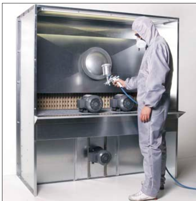
Stand de peinture A1700