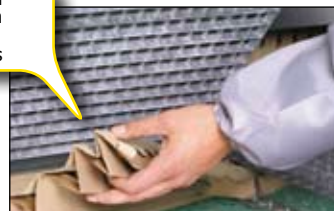
Changement de filtre rapide