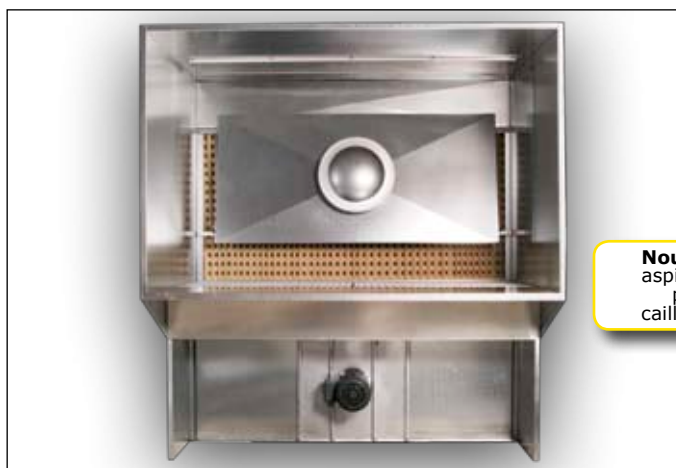
Stand de peinture A1700, A2500 avec avancée en option

De série l'appareil est livrable en deux largeurs. Mesures spéciales sur demande. En option l'appareil peut être livré avec câble et protection moteur, ainsi que des filtres de rechange.