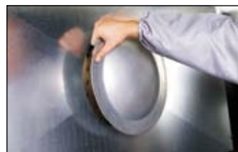
Système d'aspiration breveté