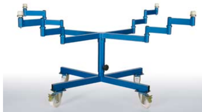
La table de pistolage pour chaque pièce