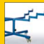
Table rotative de pistolage D10