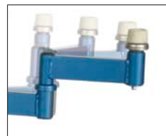
Les bras sont positionnables