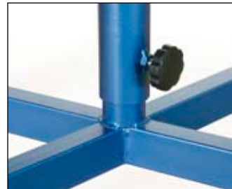
Réglable en hauteur