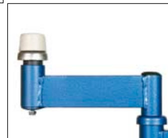
Amortissement par tampon sur ressort