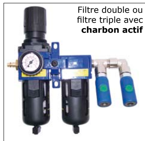
Filtre double ou filtre triple avec charbon actif

Filtre double pour application GESCHA avec support mural