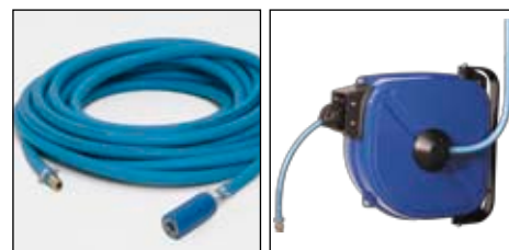
Tuyau air comprimé spécial Enrouleur