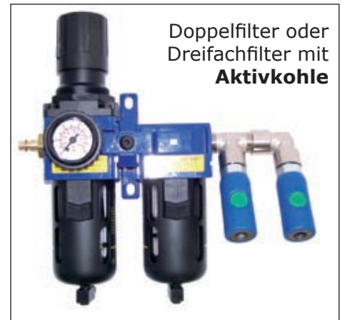
Doppelfilter oder Dreifachfilter mit Aktivkohle

GESCHA Doppelfiltereinheit für Lackierarbeiten mit Regler und Befestigung