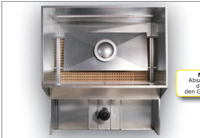
Kleinspritzstand A1700, A2500 mit optionalem Vorbau

Die Anlage ist serienmäßig in zwei Arbeitsbreiten lieferbar . Sonderausführungen auf Anfrage. Optional ist das Gerät betriebsfertig angeschlossen mit Motorschutz und Ersatzfilter erhältlich.