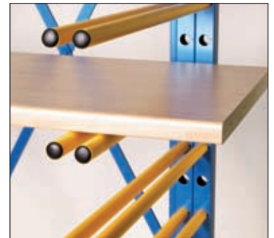
Doppelträger für größere Tragfähigkeit pro Ebene

Durch die doppelt steckbaren Trägerrohre kann auch die Tragelast einfach und schnell verdoppelt werden. Nach der Verwendung kann der Wagen platzsparend und ohne großen Aufwand zusammen geschoben werden. Der GESCHA Stabilo Flex ist zusätzlich mit stabileren Gummi-Lenkrollen und 2 Bremsen ausgestattet.