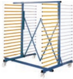
2-teilig das Plus beim Standard + vorne und hinten beladbar