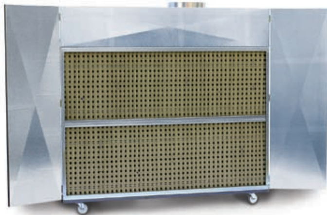
Paint JET 007-L