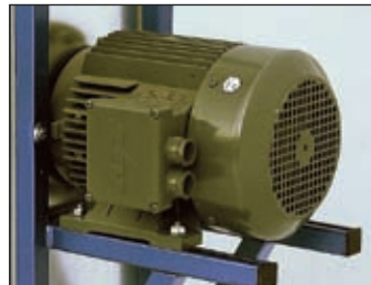
Direktantrieb für einen hohen Wirkungsgrad