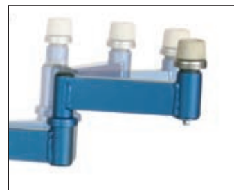
Frei wählbare Positionierung der Auflagearme