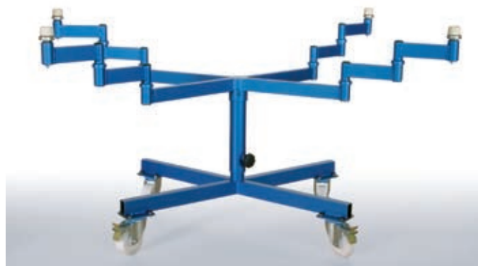
Die passende Spritzunterlage für jedes Teil: GESCHA Spritzdrehtisch D10