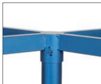
Drehwiderstand durch Rollenlagerung einstellbar