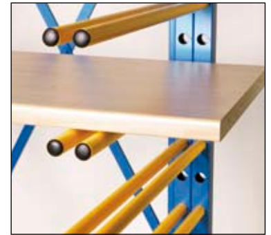
Force portante doublée pour plus grandes charges.

Par la possibilité d'emboîtement double des barres la charge peut être rapidement doublée. Après utilisation le chariot peut être replié de façon à utiliser le moins de place. Il est équipé de roulettes à revêtement caoutchouc robustes dont deux avec frein.