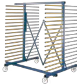
2 cotés le plus du standard+ chargeable devant et derrière