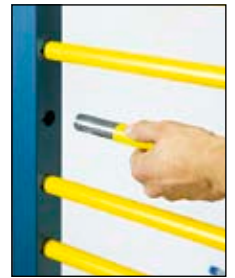
Système à emboîter GESCHA WikiWiki