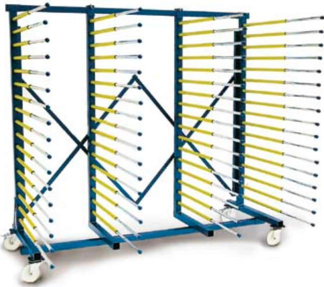
Standard+ GESCHA avec 2 râteliers supplémentaires