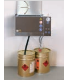
Wandversion ohne Untergestell