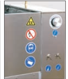
Einfache Handhabung, Abbildung mit Zeitschaltuhr, Typ GWA