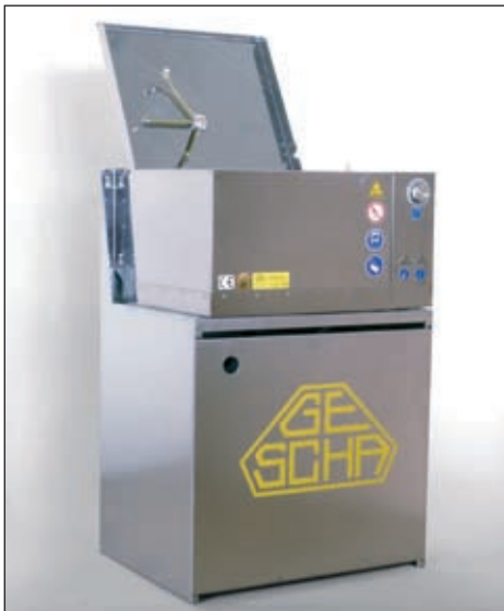
Type GW-0/A mit optionalem Untergestell