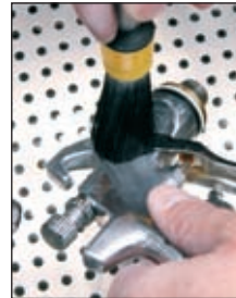
Ruckzuck Durchlaufpinsel. Die Lösemittel/Reinigungslösung läuft durch den Pinsel.