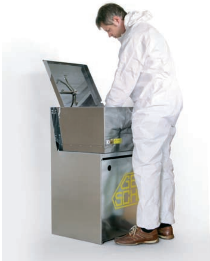
Pistolen-Waschgerät GW-0 und GW-A mit optionalem Untergestell