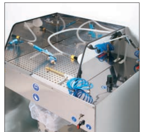
GESCHA Waschanlage GWW-P