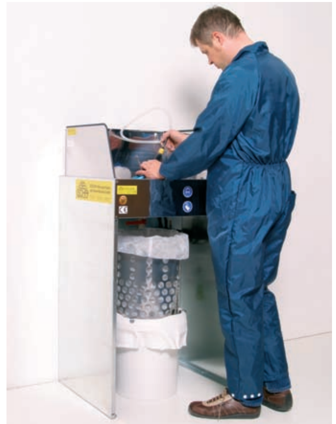
„Da macht das reinigen richtig Spaß“